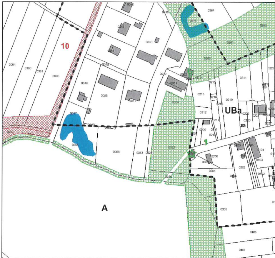
Fig. 7. Zonage après mise en compatibilité du PLU