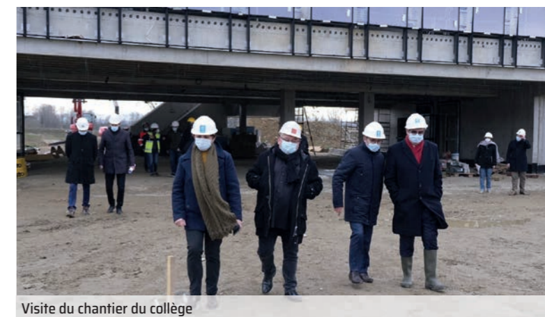
Visite du chantier du collège

Des travaux sont à venir comme la réfection de la chaussée du chemin de l'Autan, du chemin d'Espalmade, du chemin de Blandin et de la route de Saverdun à Picarrou, la sécurisation de